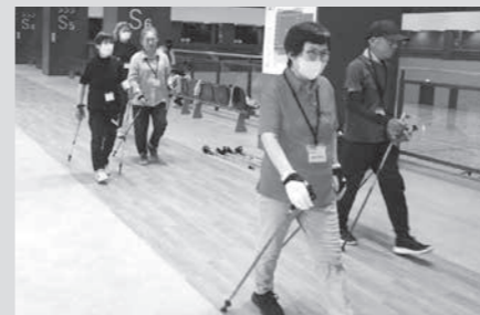
おしゃべりしながら歩けるので、無理なく楽しい!

日時 毎月第1・4(水) 午前10時～11時 場所 総合体育館ランニングコース 対象者 65歳以上の町民 費用 老人クラブ会員 100円/日 老人クラブ会員外 200円/日 その他 きくよう健康倶楽部のポイントを1日参加につき10ポイント付与します。