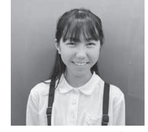
差別や偏見を見逃さず おかしいと言える人になりたい

「ミナマタ学習」で学び、私が伝えたいことが三つあります。 一つ目は、環境汚染、公害を起こしてはいけないということです。一度壊された環境は、簡単には元に戻せません。多くの時間、たくさんのお金を使って、やっと昔のようなきれいな場所になるのです。水俣も13年、485億円も費やされ、ようやく昔のようなきれいな海に戻りました。私はこのことを知って、昔のように戻って良かったと思いつつも、どうしてこうなる前に…と複雑な気持ちになりました。 二つ目は、人の命・健康