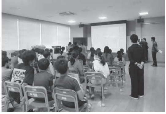
オンライン交流会の様子

菊陽西小学校では、令和5年度から台湾新竹県の「双溪国民小学校」とオンラインで交流を行っています。本年度は、6月27日にお互いの国の文化や食べ物を英語で紹介しました。子どもたちは「台湾の文化が分かった」「言葉が通じてうれしい」「もっと英語を勉強したい」など、外国への興味や学習の意欲が高まった様子でした。