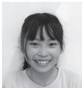
一人でもきちんと伝えるようになりたい

私は、「私は、差別をしていない」「自分のまわりには差別はない」と思っていました。でも、学習をして、もう一度考えてみると、たしかめないで決めつけをしてしまっていることや、たしかではないわさを信じて広めてしまっていることがありました。それは、前に学校でかっていたうさぎのうわさの話です。本当かどうか分からないのに、だれかが言っていて、私は、