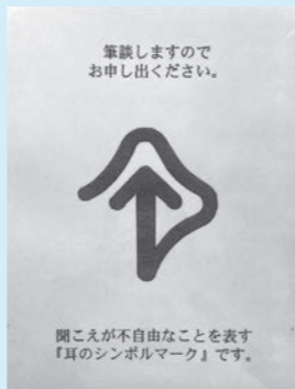
筆談も合理的配慮のひとつ

合理的配慮について、具体的にどうしたらいいか迷うときは、障がいのある人と対話を重ね、互いが意見を伝え納得できるように考え合ひましょう。合理的配慮により「誰もが住みやすい社会」を創造していくことが大切です。