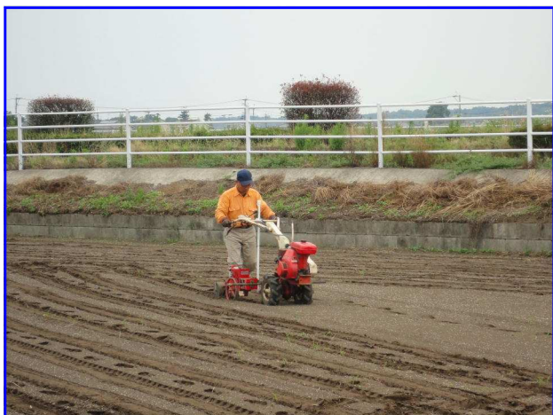
菊陽バイパス沿い