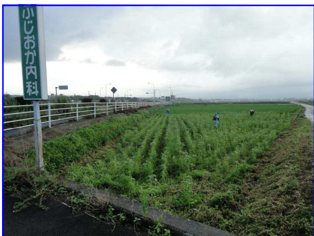
菊陽バイパス沿い