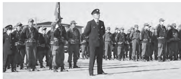
昨年度の消防出初式