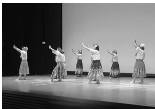
昨年度のステージ発表