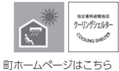
町ホームページはこちら

社会保険に加入した場合、国保から脱退するための届け出が必要です。国民健康保険税と職場の健康保険料を二重に支払ってしまうことがあります。早めの手続きをしましょう。