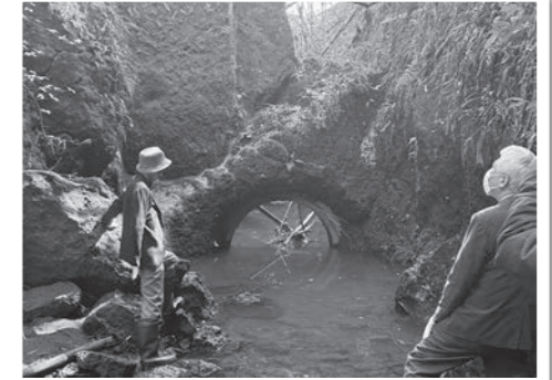
井手底視察の様子

約400年前に築造された馬場楠井手の曲手～辛川間に築かれています。井手の水流を遮るように、通水孔を備えた岩壁があることで、渦状の複雑な水流が発生し、この渦によって、井手の水に含まれる火山灰(ヨナ)や土砂が巻き上げられるため、鼻ぐり周辺では井手底に土砂などがほとんど堆積しません。この特殊な構造は、全国に類例がない大変珍しいものです。