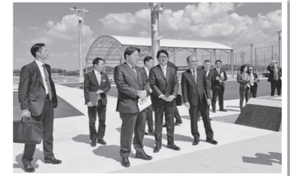
林総務大臣が視察する様子

今後も本施設を拠点に、にぎわいの創出と持続可能なまちづくりを推進してまいります。