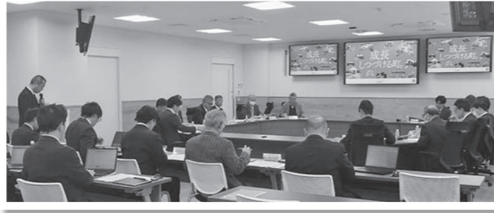
第1回菊陽町立地適正化計画策定委員会の様子

令和7年3月に見直しを行った「菊陽町都市計画マスタープラン」に基づき、農業・工業・商業、そして住環境と自然環境がバランスの取れた効果的な土地利用の実現に向けた取り組みを進めています。この効果的な土地利用の実現には、将来の人口減少を見据えたコンパクトな都市づくりが必要不可欠であり、この取り組みを具体的に位置付けるため、現在、菊陽町立地適正化計画の策定を行っています。