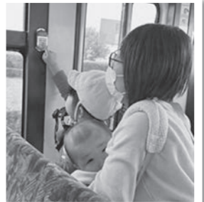
「せーの!」で降車ボタンを押す子どもたち