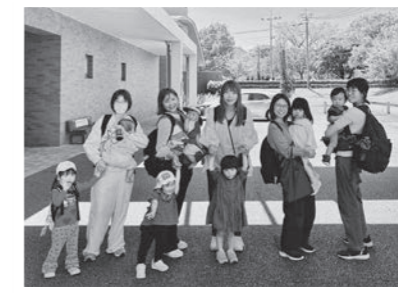
参加した親子の皆さん

外の景色を眺めながら親子で会話をし、降車ボタンもみんなで「せーの!」で押すなど、とても楽しそうにキャロッピー号に乗っていました。子どもたちからは「また乗りたい!」との声もあり、大満足の様子でした。