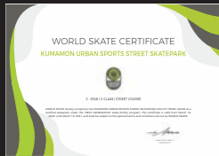
ストリートコース認定証