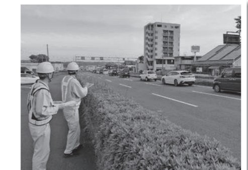
菊陽空港線の朝の調査状況

今後も継続的に調査を実施し、その結果は、県や関係自治体と情報共有しながら、現在進めている道路整備の効果や課題を検証して、今後の取り組みに活用します。なお、調査結果は、取りまとめ次第、ホームページに公表します。