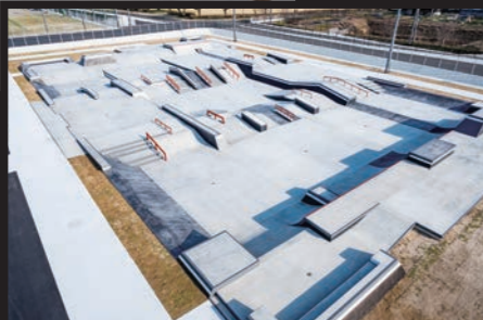
ストリートコース

すり鉢状の形をした「パークコース」と街中にある階段や手すりを再現した「ストリートコース」があります。国際競技連盟ワールドスケートの基準で最高ランクの「5スター」を取得し、世界大会の開催も可能です。