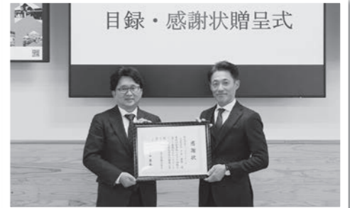
左から、吉本町長、下吉代表取締役