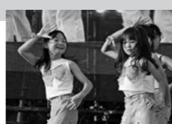
ステージでダンスを披露する出演者(昨年度)

申込期限 6月12日(金) ※応募多数の場合は事務局で選考します。詳しくは、町ホームページをご確認ください。