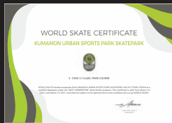
パークコース認定証

この評価は、オリンピック会場と同等の競技環境を備えており、国際基準に沿った安全設計であることを示すものです。