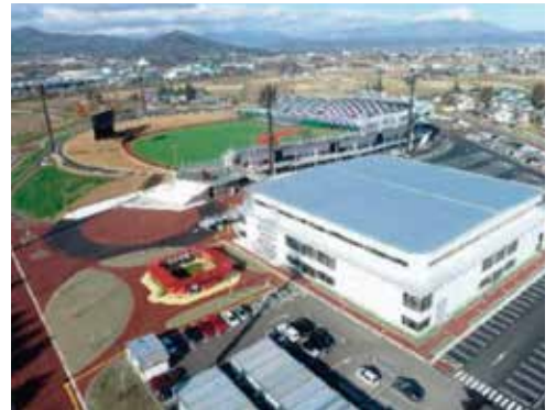
きたぎんボールパーク (いわて盛岡ボールパーク)

A 「野球場誘致支援業務委託」事業は、県の公募に向け、候補地の新球場を整備した場合のイメージや整備費用などの調査、民間活力の導入を含む事業スキームの整理など、提案の魅力を向上させるための業務支援である。