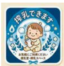
【搾乳できますマーク】

Q 現在、多くの人が利用する施設には、赤ちゃんにミルクをあげることができ「授乳室」の設置が進んでいるが、授乳室で「搾乳」もできることについては、理解が進んでいない。赤ちゃんがいらないのに、授乳室に入るには周りの目があり入りづら。現在、全国では「搾乳できます」の自治体独自のマーク設置が数多く推進されている。「搾乳できます」のマーク設置を提案するが町はどのように考えているか。