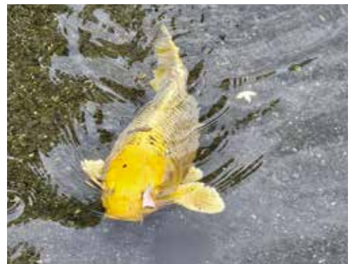
豊かな湧水（水前寺）

A 水循環型営農推進協議会による夏期及び冬期の水田湛水事業で、年間2712万トン、白川中流域等水稲作付推進協議会の事業で533万トンの地下水涵養を見込んでいる。雨水浸透枘、雨水タンク、雨庭の設置にも取り組んでいる。