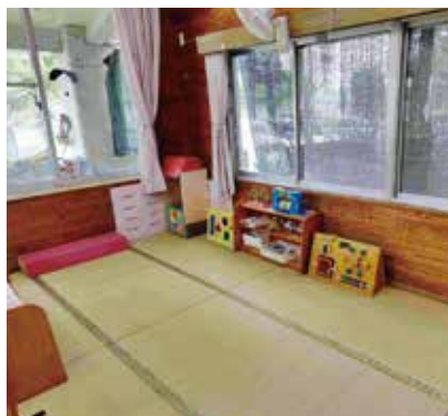
町立保育所みどり園