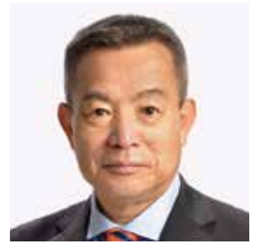
布田 悟 議員