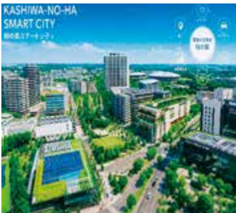
柏の葉スマートシティ