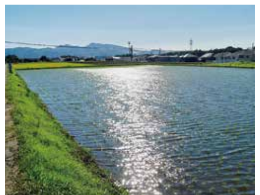
水稲作付（湛水事業）

A いずれも熊本県に関する分野であるが、熊本県は法令に基づく監視や県民の不安解消や予防対策として、法令の規制外物質も対象としたモニタリング調査を実施している。