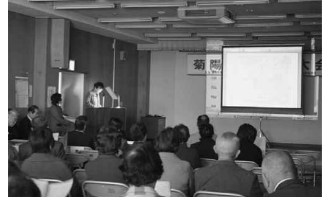
▲モデル公民館実践発表