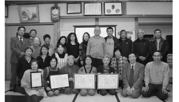
▲みんながたグリーンクラブの皆さん

大会では、各都道府県の代表が、さまざまな地球温暖化防止に向けた取り組みの発表をしたなかで、同クラブの「ゴーヤグリーンカーテン」の取り組みが評価され今回の受賞となりました。おめでとうございます。