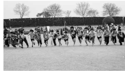
▲りりしい表情でスタート

【規定】 優勝 鉄砲小路A 準優勝 上津久礼子ども会 第3位 新成区子ども会 【オープン】 優勝 曲手子ども会 準優勝 八久保子ども会 第3位 杉並台子供会