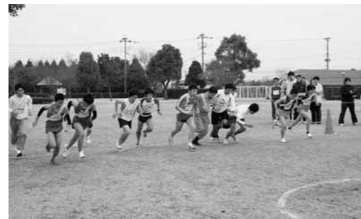
▲ゴールをめざしてスタート

この大会には、町内外の中学生から各職場で作った社会人のチームなど13チームが参加し、6区間の13.8キロのコースを力強く走りました。大会の結果は、次のとおりです。