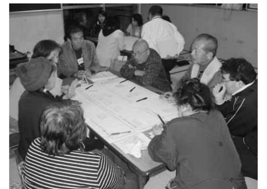
▲熱心な話し合いが行われました