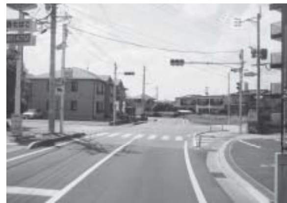
▲光の森五丁目コンビニ前交差点

平成20年度の設置箇所は、新山一丁目コンビニ前交差点、光の森五丁目コンビニ前交差点、光の森一丁目銀行南側交差点の3カ所です。