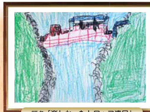
題名「楽しかったトロッコ遠足」