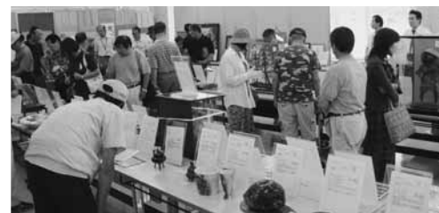
▲8月に行われた公売会