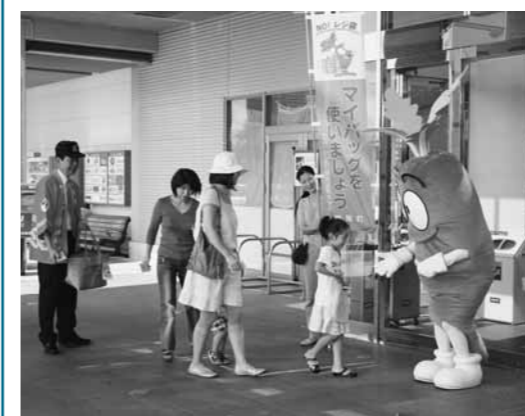
▲キャロッピー君もマイバッグ啓発に参加