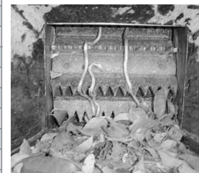
▲破砕部分に針金が巻きつき故障した例