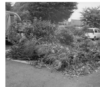
▲樹木粉碎処理の様子