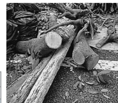
▲処理できない木の例(木の根・直径12cm以上の木)