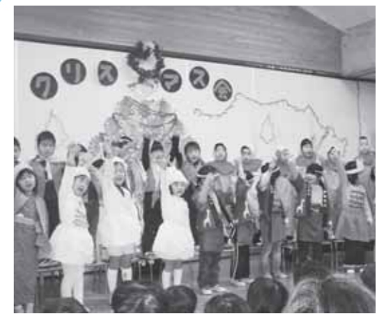
みどり保育園の クリスマス会 年長さんの元気な歌声!