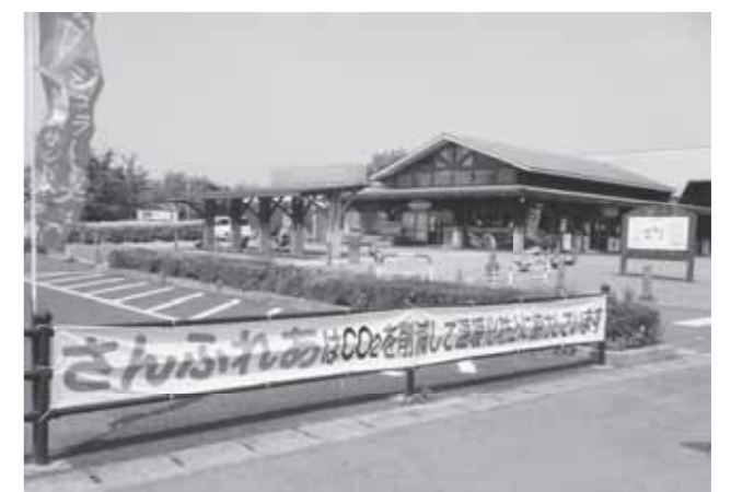
▲さんふれあは地球温暖化防止に協力しています