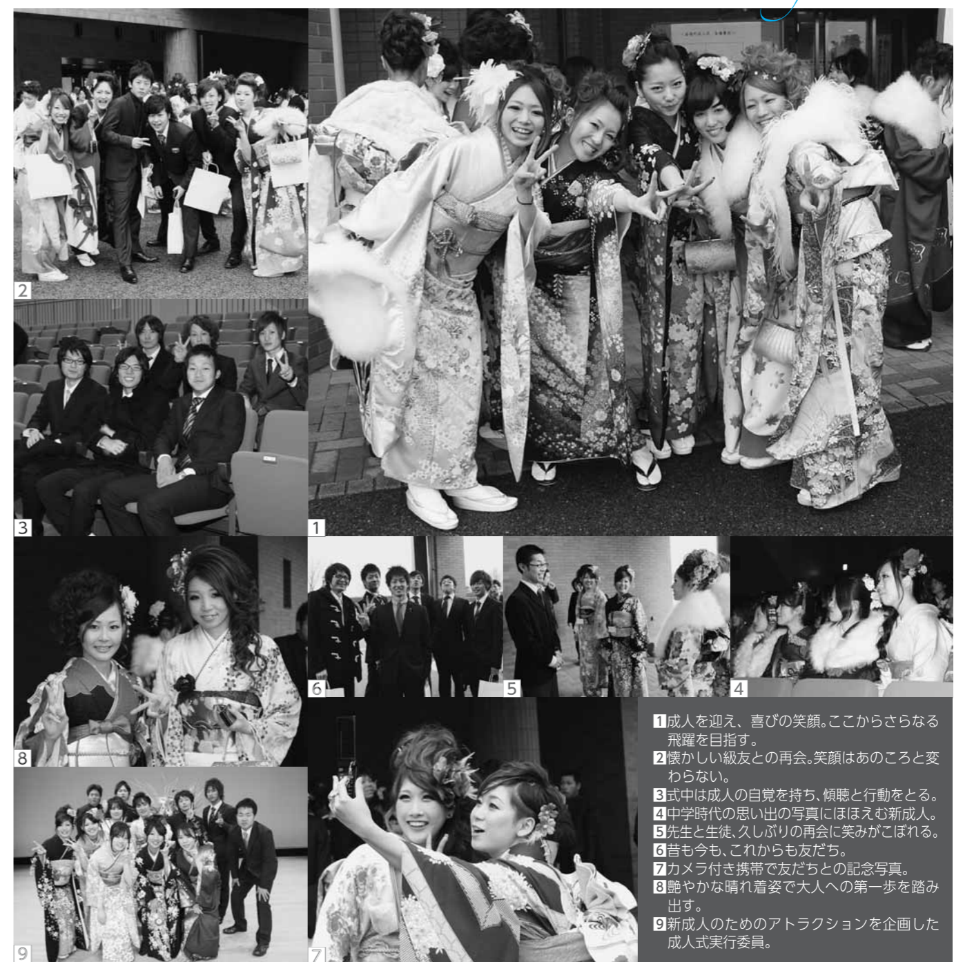
1 成人を迎え、喜びの笑顔。ここからさらなる飛躍を目指す。 2 懐かしい級友との再会。笑顔はあのことと変わらない。 3 式中は成人の自覚を持ち、傾聴と行動をとる。 4 中学時代の思い出の写真にほほえむ新成人。 5 先生と生徒、久しぶりの再会に笑みがこぼれる。 6 昔も今も、これからも友だち。 7 カメラ付き携帯で友だちとの記念写真。 8 艶やかな晴れ着姿で大人への第一歩を踏み出す。 9 新成人のためのアトラクションを企画した成人式実行委員。

成人するということで、責任のある仕事をさせてもらいました。自分たちで一つのものを作り、みんなに楽しんでもらったのはうれしいです。