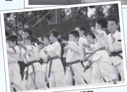
▲少林寺拳法の力強い演舞