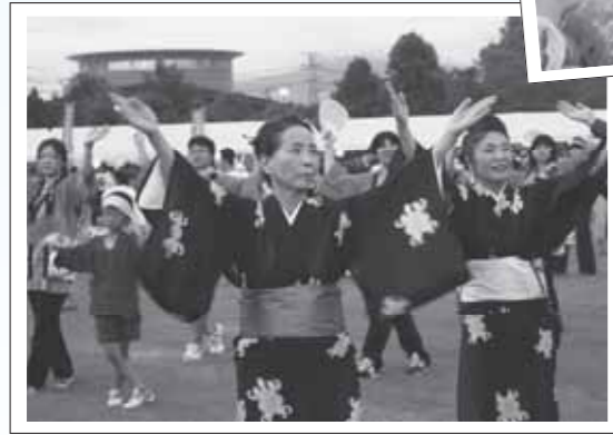
▲音楽に合わせて、町民一体となって踊った総踊り