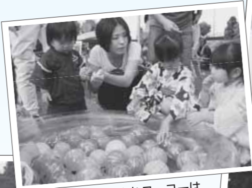
▲カラフルなヨーヨーは子どもたちに大人気