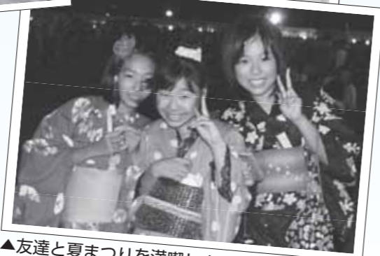
▲友達と夏まつりを満喫しました