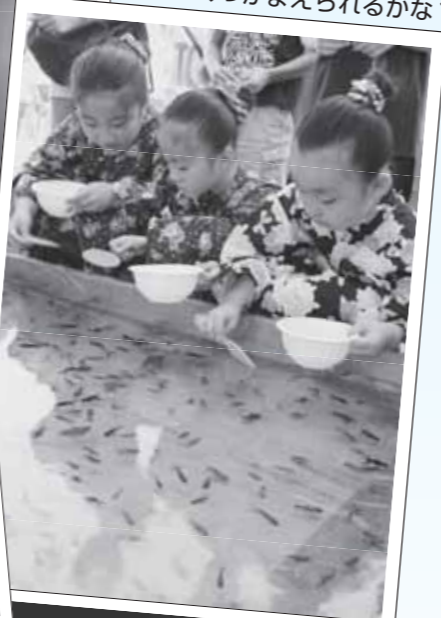
▼「金魚すくい」うまくつかまえられるかな？