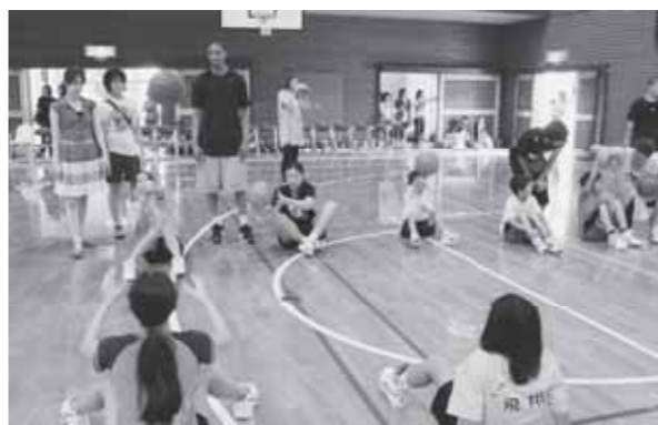
▲プロ選手から教わった練習方法を実践

アメリカのプロバスケットリーグI BLの今季優勝チーム、バンクーバーボルケーノーズの選手ら10人が8月5日、菊陽中学校で町内の小中学生70人に「バスケットクリニック」を行いました。これは、「熊本にプロバスケットボールチームをみんなで創ろう会」が、熊本の子どもたちに本物のバスケットに触れてもらいたいとの思いで企画したものです。