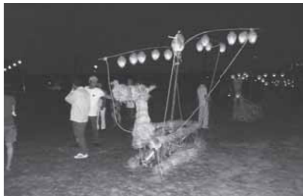
▲住民手作りの施餓鬼船

上津久礼の伝統行事「川施餓鬼」が8月19日、上津久礼区で行われました。川施餓鬼は330年以上続いており、町の無形民俗文化財に指定されています。