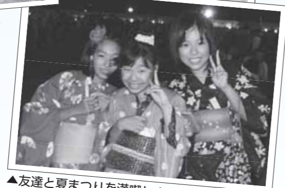
▲友達と夏まつりを満喫しました