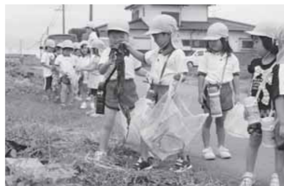
▲お友達と一緒にごみ拾い

こうのとりの保育園の年長組、年中組の園児たちが7月21日、園周辺の散歩コースのごみ拾いをしました。