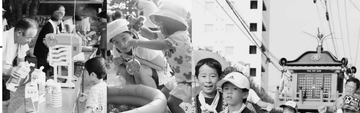
1_ かき氷、焼きそばや焼き鳥などの出店には列ができる。2_ ヨーヨーつりやくじ引きなど子どもに人気の出店も立ち並ぶ。3_ 「わっしょい」のかけ声と共に区内を回る子どもみこし。