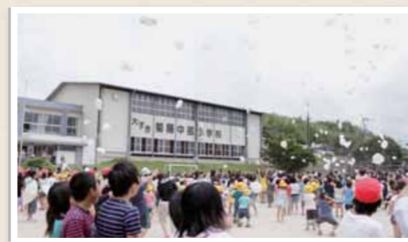
▲「今までありがとう」の思いを込めて風船を飛ばす

新校舎建て替えのため取り壊される菊陽中部小学校で、「ありがとう さようなら集会」が7月20日に行われました。集会では、各学年の代表者が「入学した頃は迷子になった「友達がたくさんできて、いっぱい遊んだ」と校舎での思い出を発表しました。また、みんなで「お世話になった中部小学校。今までありがとうございまして」と声をそろえて感謝を表しました。その後、校庭に移動した児童たちの前に、サプライズでくまモンが登場。一緒にくまモン体操を楽しんだ後、班ごとに校舎への感謝の思いを書いた紙風船を空高く飛ばしました。たくさん思い出が詰まった小学校。校舎が建て替えられても、思い出はずっと児童たちの心に残ることでしょう。