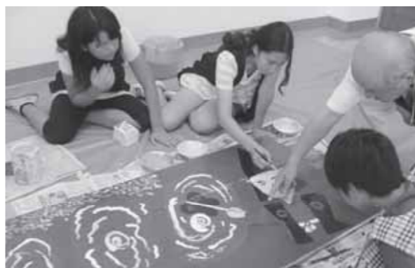
▲展望台への大看板に色を付ける

平成23年度世代間交流事業「高齢者と子どものさわやかふれあい会」が8月5日、南部町民センターで開催され、約100人の地域住民がさまざまな行事を楽しみました。