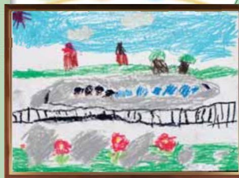
「しんかんせんにのったよ」