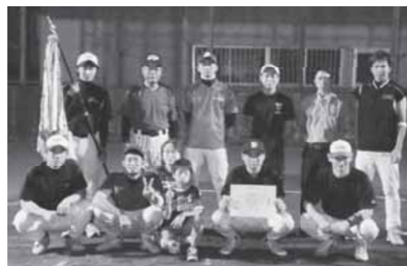
▲優勝した新町区の皆さん

第29回地区対抗軟式野球ナイター大会が7月11日～7月21日、町民総合運動場で開催されました。