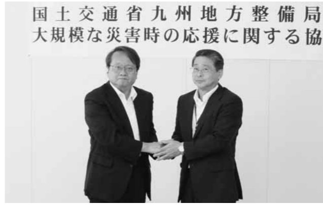
▲協定締結後に握手を交わす中富副町長と熊本国道河川事務所長

また、支援の主旨、方法や役割分担などについて、平常時から共通認識を持つことで、相互の連携・支援がより円滑に進むことも期待されます。