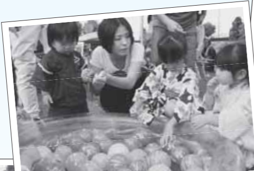
▲カラフルなヨーヨーは子どもたちに大人気