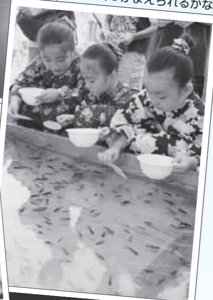
▼「金魚すくい」うまくつかまえられるかな？