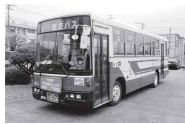
▲町内巡回バス。前面の旗(赤茶色)が目印です

今回開催した会議では、皆さんのアンケートをもとに、皆さんがどこで買い物をしているのか、どの病院に通院しているのかといった生活実態を分析し、現在提供している公共交通サービスをそれと合わせて分析