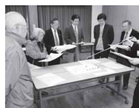
▲模型を囲んで活発に議論する委員

会議では、施設のコネプトについて意見が出され、特に地域交流と子育て支援は、施設の大きな柱として位置付けられました。また、具体的なイメージを構築するため県外施設を見学し、玄関から各諸室までの動線や採光の方法、駐車場の広さなどを参考にしました。さらに、間取