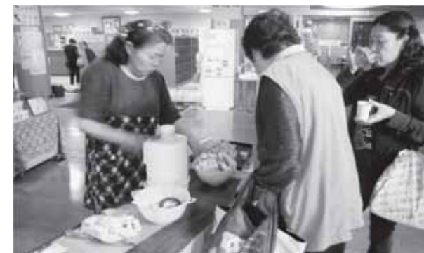
▲多くの人が菊陽産にんじんジュースを試飲しました

町の特産物であるにんじんをもっと多くの人に知ってもらおうと、菊陽町農産加工グループ連絡協議会による菊陽産にんじんジュースの試飲会が5月14日、菊陽町総合交流ターミナルさんふれあで行われました。にんじんをジューサーでジュースにするだけで、とてもおいしく飲むことができ、菊陽町のにんじんのおいしさを感じることができます。試飲した人からは、「今度から家でも作ってみる」との声も上がるほど好評でした。