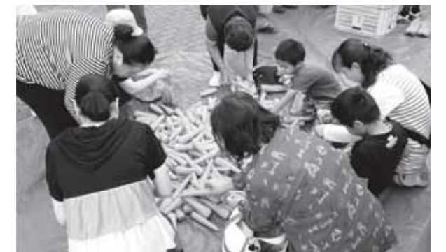
▲袋いっぱいのにんじんを詰め込む来場者

さん彩出荷協議会による「春の感謝祭」が5月20日、菊陽町総合交流ターミナルさんふれあで開催されました。町特産のにんじんの詰め放題コーナーや、ぜんざいの振る舞いコーナー、生のにんじんジュースの試飲もあり、会場内は大勢の来場者でにぎわいました。生のにんじんジュースを試飲した人からは、「甘くて飲みやすい」と大変好評でした。また、会場にはキャロッピーも駆けつけてくれ、子どもたちに大人気でした。