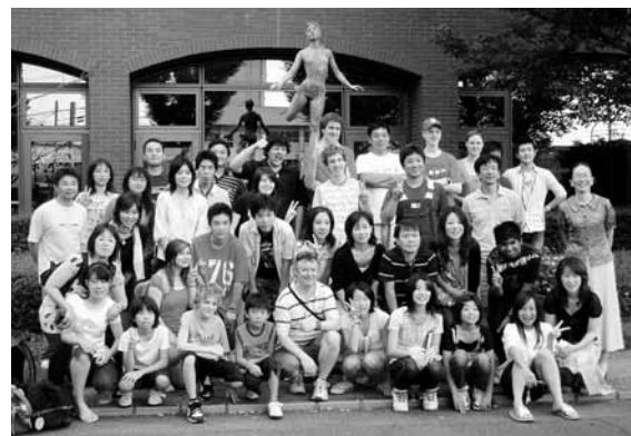
▲生徒とホストファミリーの記念写真

本年度も7月23日から8月5日まで、町から12人の中学生を派遣し、現地のホストファミリーや生徒たちと交流を図っています。9月中旬には、バックスマーシユグラマー校から生徒と先生を迎え、町の中学生と交流を行う予定です。それに伴い、バックスマーシユグラマー校生徒のホストファミリーとしてご協力いただける家庭を募集します。