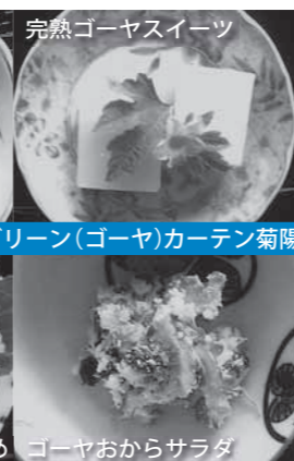
グリーン(ゴーヤ)カーテン菊陽さん