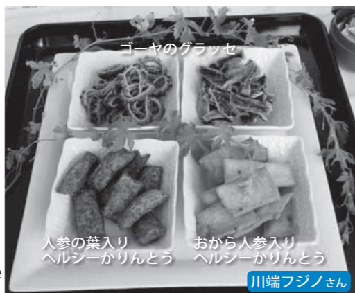
人参の葉入りヘルシーかりんとう おから人参入りヘルシーかりんとう