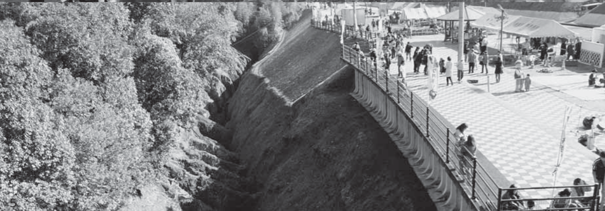
1_低い姿勢で屈みながら鼻ぐり井手底の穴をくぐっていく。現存24基 / 2_馬場楠地区に古くから伝わる「馬場楠の獅子舞」は町の無形民俗文化財 / 3_昼食の時間にはずらりと行列が並ぶ / 4_鼻ぐり井手を知ってもらうため菊陽南小3・4年生が来場者をガイド / 5_約400年前に築造された鼻ぐり井手。全長約390m。鼻ぐり大橋から撮影