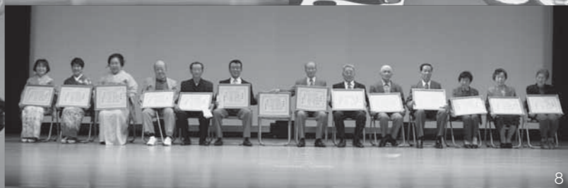
1_30周年の記念すべき歌謡部発表会 / 2_コミカルなひよっとこの踊り / 3_息をぴったり合わせたバレエ / 4_文化祭中57,874円の寄付金が寄せられる / 5_切り絵を体験 / 6_日舞を優雅に舞う / 7_ジュニア・ジャズストリートの華麗なダンス / 8_文化協会永年在籍者14人へ表彰状を贈呈