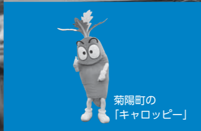
菊陽町の「キャロッピー」