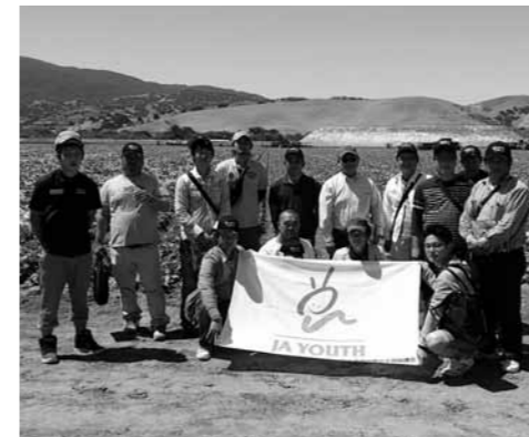
▲一緒に参加した熊本県農協青壮年部の皆さん

この自社ブランドは、アメリカの消費者趣向が深く関わっており、私が見学した農場でも、最近アメリカの富裕層で増えている健康志向のニーズに対応して、有機栽培や自然栽培が行われていました。また、そのような消費者のニーズに対応する動きは、スーパーマーケットでも見