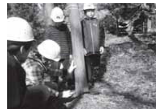
▲森林組合の指導を受け真剣に伐採する児童たち

伐採を体験した緑の少年団の子どもたちは「時間がかかったけどおもしろかった」と話し、満足そうな笑顔が見られました。