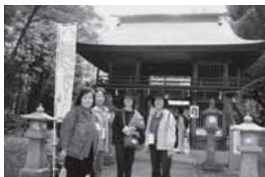
▲スタンプラリーを楽しむ参加者たち

また、鉄砲小路まちづくり期成会によるのっぺ汁などのおもてなし、さんふれあでは抽選会、菊陽産の野菜や山内本店の味噌などのプレゼントがあり、参加者は「いいお土産になった」と喜んでいました。