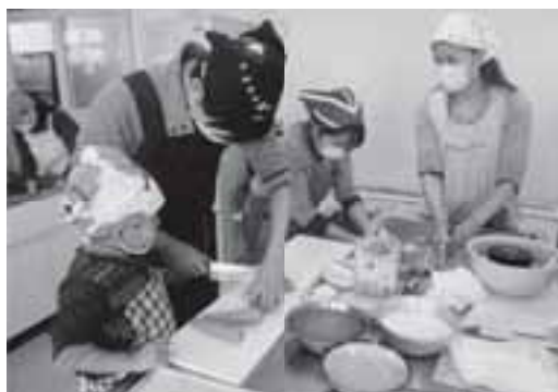
▲親子で楽しく料理作り

講習会では、菊陽産の野菜を使ったにんじんポタージュパングラタン、サラダ、寒天プリンが作られました。講習会に参加した親子からは「野菜を使って簡単にできるので、家でも作ってみたい」との声が上がるほど好評で、楽しみながら料理を作る姿や地産地消の話にしっかりと耳を傾ける姿が見られました。