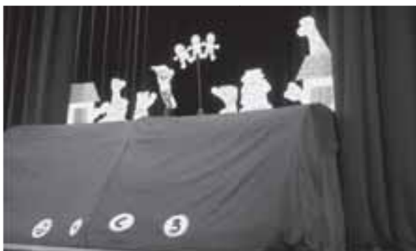
▲人形劇ぶっくるの昔話「たのきゅう」

第13回おはなしフェスティバルが11月23・24日に菊陽町図書館で開かれました。23日は図書館ホールで図書館職員とボランティアが「おんがくねずみジェラルディン」の読み聞かせと楽器演奏を交えて披露。人形劇ぶっくるは昔話「たのきゅう」などを熱演し、満員の観客から大きな拍手が送られました。24日はおはなしの森さんさんが「スペシャルおはなし会」を行い、ブラックパネルシアター「三びきのこびた」や紙芝居、語りなどを披露。多くの家族連れがおはなしの世界を楽しみました。