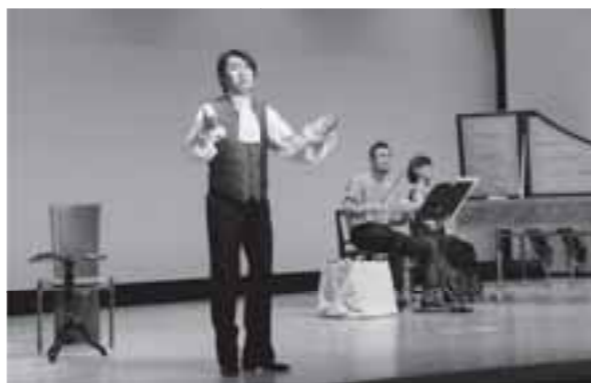
▲一人音楽劇のワンシーン