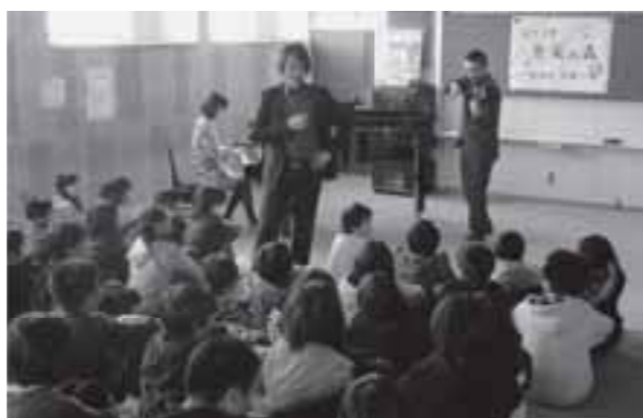
▲武蔵ヶ丘北小でのアクティビティ(地域交流)

12月1日のコンサートでは、一人音楽劇やヴァイオリン・ソナタなどでバロック音楽の魅力を満喫。後半では、観客全員で歌うクリスマスソングが会場いっぱいに響き渡りました。また、図書館ホール初お目見えのチェンバロによる独奏も披露。終演後には、舞台上でチェンバロが公開され、多くの観客が間近でチェンバロを見ることができ、実際に楽器に触れることができた子どもたちなどは大喜びでした。