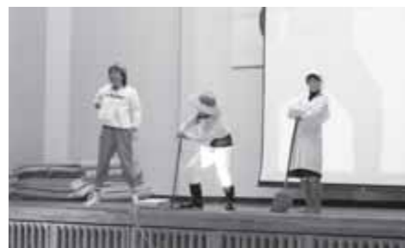
▲先生によるロールプレイで分かりやすく説明

町では、認知症の人やその家族を理解し、地域で支えるためにサポーター養成に力を入れています。認知症の講義に加え、先生たちによるクイズ形式のロールプレイを行い、生徒たちは認知症についての理解を深めました。講座の後には、「認知症サポーター」の証としてオレンジリングを配布しました。