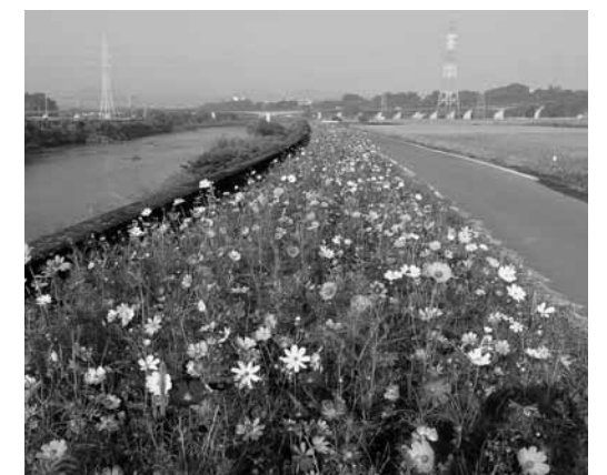
▲農道へのコスモスの植栽