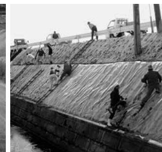
▲防草シートの設置