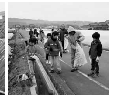
▲水路、農道の空き缶拾い

農地・農業用水などの資源は、これまで集落など地域の共同活動により保全管理されてきました。これらの資源は、農業だけでなく農村の豊かな自然環境や景観を形づくる上でも大きな役割を果たしています。