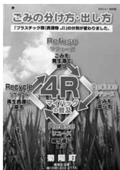
▲ごみの分け方・出し方冊子

「ごみの分け方・出し方」の冊子などは、役場や各町民センターなどの関係施設で受け取ることができます。