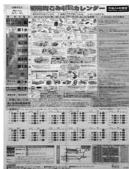
▲ごみ収集カレンダー