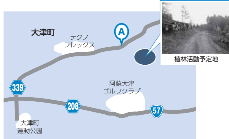
▲A地点までバスで行き、山の入口からは徒歩で移動(約3km)