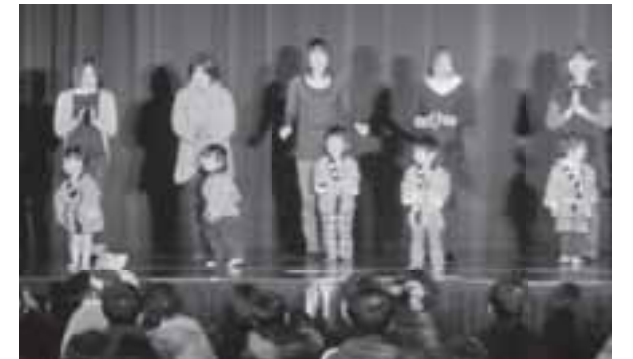
▲児童館の親子ゆうぎ発表

ステージ発表では、児童館の子どもたちのかわいいダンスや、講座生が日頃の学習や練習の成果を披露しました。展示の部では、素晴らしい作品が会場いっぱいに展示されました。リサイクルバザーや焼きイモなどのバザーも人気でした。最後はお楽しみ抽選会があり、とても盛り上がったセンター祭となりました。