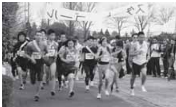
▲総勢35チームが一斉にスタートを切った

【一般】優勝:あじまん、準優勝:菊陽中職員A、第3位:さんりぎ茶屋【中学生】優勝:菊陽中A、準優勝:武蔵ヶ丘中B