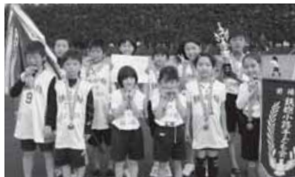
▲規定の部で優勝した鉄砲小路子ども会

【規定】優勝:鉄砲小路子ども会A、準優勝:緑陽台子ども会A、第3位:緑ヶ丘子ども会A【オープン】優勝:緑ヶ丘子ども会B、準優勝:鉄砲小路子ども会B、第3位:緑ヶ丘子ども会C