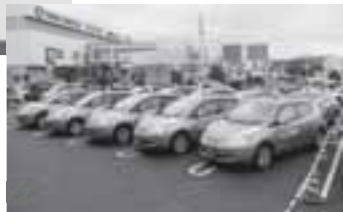
勢ぞろいした▶ 電気自動車タクシー