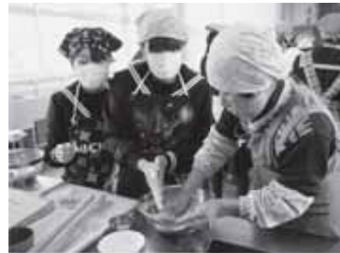
▲あんもちだご汁をつくる生徒と講師

また、郷土料理についての話や講師が子どもの頃に食べていた料理などの話について耳を傾ける生徒たちの姿が見受けられました。