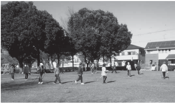
▲ウォーキングをする参加者たち

ウォーキングは、家の近所など、いつでも・どこでも手軽に行えるというメリットがあります。さらに、有酸素運動であるウォーキングは、生活習慣病や認知症などの予防効果やアンチエイジング効果なども期待できます。