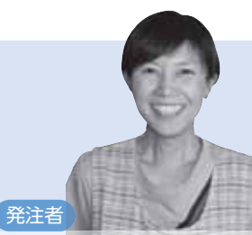
発注者 ひまわり育成クラブ