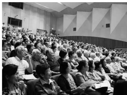
▲警察力の強化を願い、約650人が参加しました

内に新設されることから、町西部地域の犯罪の増加や治安の悪化が心配されています。大会では、町の警察力強化のため、菊陽町に大津警察署の菊陽分署または菊陽光の森交番の設置、警察官の重点配置、警察機動力の充実整備を求める決議を行い、満場一致で承認を得ました。また、菊陽分署または菊陽光の森交番ができるまで、今後も引き続き活動していくことも併せて確認しました。