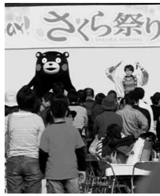
▲昨年のさくらまつりの様子

日時 3月30日(日) 午前10時～午後4時 開場：午後9時30分 場所 富士フィルム九州構内 (菊陽町津久礼2900番地) 司会 MEG、英太郎 ※くまモンも登場! 内容 菊陽町の農産物販売や出店、各種団体によるステージイベント、豪華景品が当たる大抽選会など ※内容は変更する場合があります。 駐車場 さんふれ西側駐車場(砂利敷) その他 菊陽杉並木公園駐車場から無料シャトルバスを運行します。ぜひご利用ください。 問い合わせ 富士フィルム九州(株)総務部 ☎(340)9000