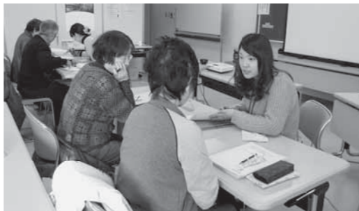
▲保健師とグループワークで目標の確認を行う参加者