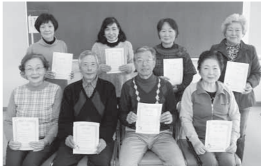
▲修了証を手にし、晴れやかな表情を見せる参加者