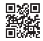
大気環境情報メールのQRコード

※スマートフォンでの空メール送信は件名に任意の1文字(「あ」など)を入力してください。