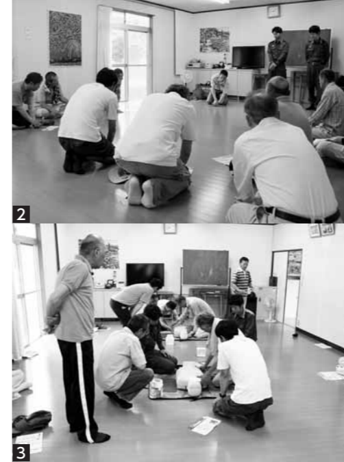
1 平成24年7月12日、九州北部豪雨で白川が氾濫して町内の農地や住宅地が浸水 2 6月15日、菊池広域連合消防本部の救急救命士から心臓マッサージの方法やAEDの使い方など救命処置の手順を学ぶ東ヶ丘区自主防災組織の皆さん