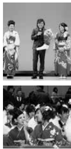
▲新成人の笑顔で華やいだ昨年の様子