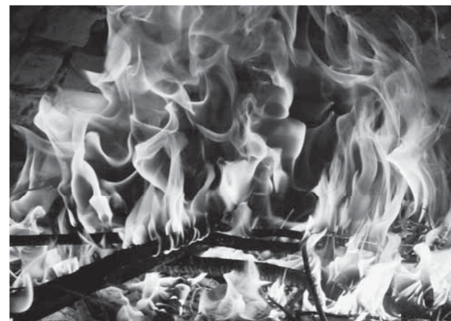
▲悪臭やダイオキシンの発生原因になる野焼き

野焼きを行うときに発生する煙は悪臭や大気汚染の原因になり、周りの人々に大変迷惑です。野焼きでは焼却温度が200℃～300℃程度にしかならず、燃やすものによってはダイオキシンの発生原因になるともいわれています。