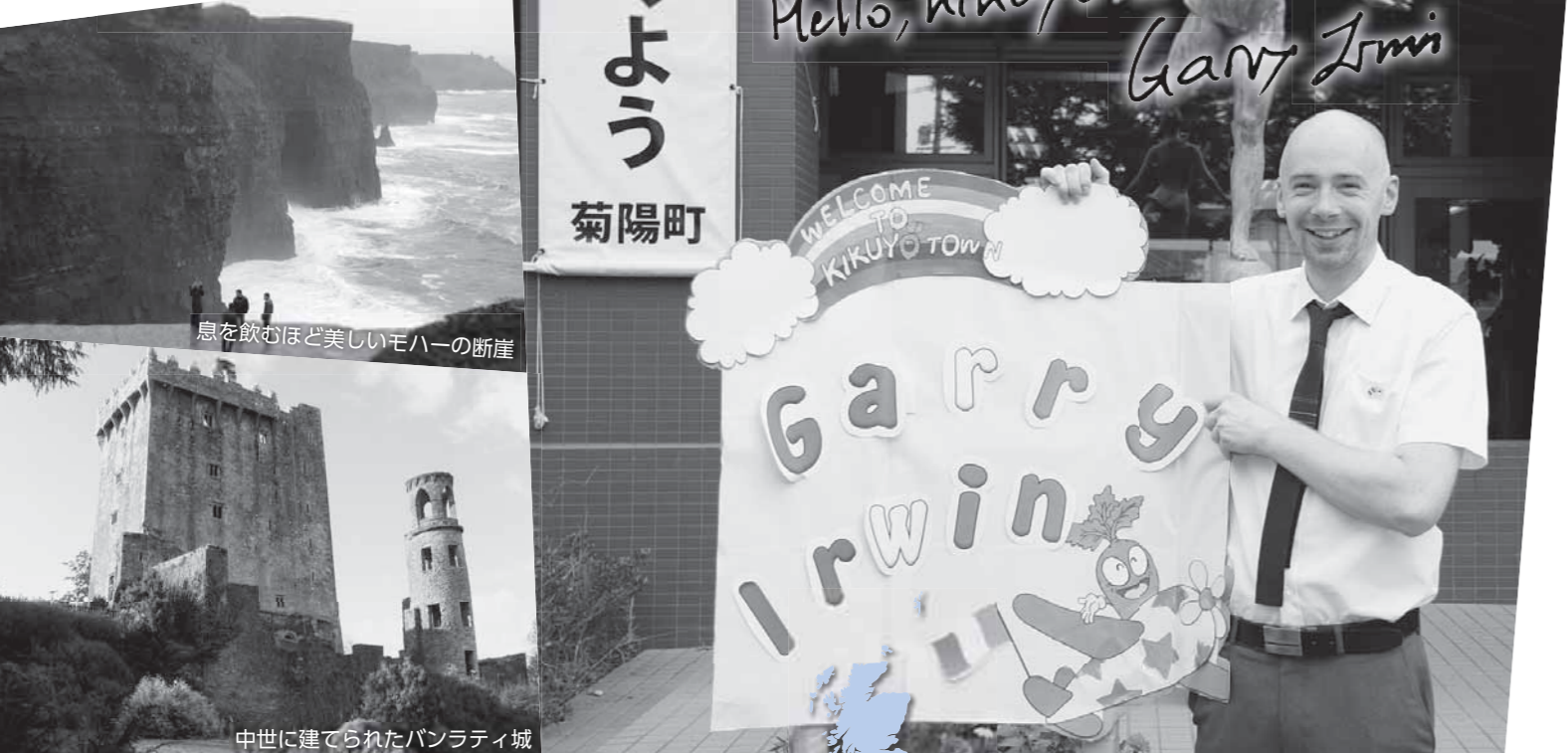
息を飲むほど美しいモハーの断崖