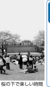
桜の下で楽しい時間

桜咲く野外で皆さんと楽しい時間を過ごしましょう。 日時 3月22日(日) 午前9時45分～午後3時30分 場所 ふれあいの森公園 ※雨天時はふれあいの森研修センターで行います。 内容 菊陽北小学校区と講座生のステージ発表や作品展示、食パザール、お楽しみ抽選会など