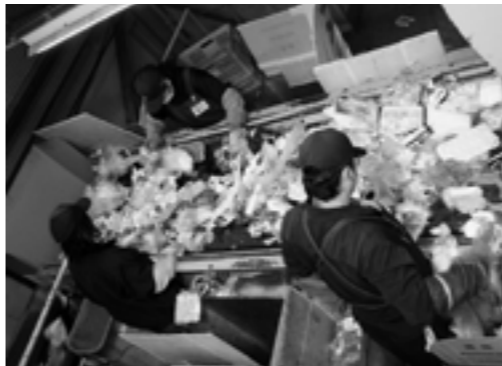
▲プラスチックごみを手作業で選別する環境美化センターの職員

これは皆さんのごみの量に応じて、ごみ処理経費の一部を公平に負担してもらおうものです。当時、町内全域で説明会を開催して始めました。