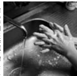
きれいな手で元気に過ごそう♪

寒い時期は感染が増えます。健康被害を食い止めるためにもきちんと手を洗いましょう。 ▼日時 11月16日(月) ▼会場 2時～午後3時30分 ▼申し込み 午後7時30分～午後8時50分 ※どちらかに参加してください。