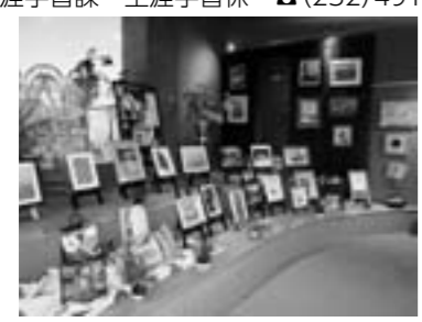
心躍る芸術の秋を満喫♪

町民と小中学生の芸術作品を展示します。作る人と訪れた人が出会い、交流できる機会です。気軽にお立ち寄りください。 ▶日時 11月22日(日)～11月25日(水) 午前9時～午後4時30分 ※22日(日)は午後1時30分開場、25日(水)は午後1時に終了します。 ▶場所 光の森町民センター ▶問い合わせ 生涯学習課 生涯学習係 ☎(232)4917