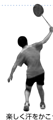
楽しく汗をかこう

▼日時 12月13日(日) 午前9時～午後5時 ▼場所 菊陽中学校体育館・町 民体育館 ▼対象者 小学4年生以上の本 町在住の人が町内勤務の人 ▼種目 男子・女子ダブルス ▼費用 1チーム千円 ▼申込期限 12月1日(火) 午後5時 ▼申し込み・問い合わせ 町民体育協会 ☎(233)1520