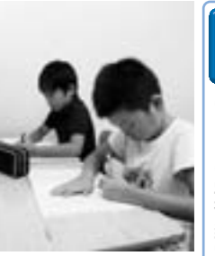
子どもたちの可能性を広げます♪

「塾に通うのが難しい」「勉強する習慣を身に付けたい」など、学習意欲のある子どもたちを応援します。退職した元教職員や大学生が先生です。 「学習支援員」として子どもたちをサポートする先生と学習場所も募集します。 ▼開所日 週1回以上 ▼対象者 ひとり親家庭の小・中学生 ▼費用 1回につき100円 ※実施場所・学習支援員・子どもたちの調整ができた教室から順次開きます。 ▼問い合わせ 県母子寡婦福祉連合会 ☎(324)2136