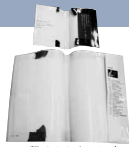
はぎ取られた本のカバー