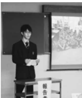
海外での経験を報告する生徒

働く場の創出は地方創生の最も重要な課題です。商工業では企業の立地や販路の拡大などを支援します。農業では農産物や加工品のブランド化、生産・加工・販売を一体化した6次産業化を支援します。