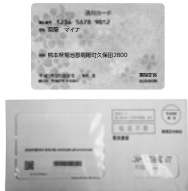
こちらの封筒で届きます

現在、12桁のマイナンバーが記載された通知カードが住民票の世帯ごとに送られています。1月から、公的機関や勤め先などにマイナンバーの提示が必要です。主に町では下記の手続きで通知カードか個人番号カードが必要ですので、担当課窓口や西部支所に持参してください。通知カードが届いていない人は町民課の窓口で受け取れます。事前に町民課にご連絡ください。