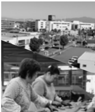
商工業・農業の活性化を支援