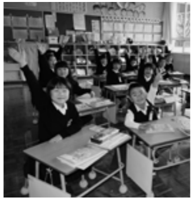
授業で元気よく手をあげる南小児童

菊陽南小学校区への子育て世帯の定住を促進するため、新たに対象地区へ転入または転居する人に補助金を交付しています。