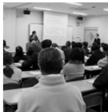
▲昨年もにぎわった集い

ことしのテーマは「メンタルヘルス」です。心の病気は誰もがかかる可能性があります。皆さんも心の健康や病気について考えてみませんか。どなたでも自由に参加できますので、ご来場をお待ちしています。