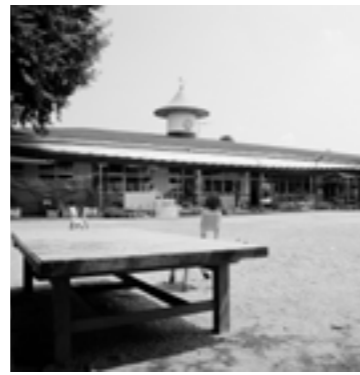
▲思い出いっぱいのもみじ園

1月末からの旧園舎解体工事を前に、もみじ園にゆかりのある皆さんに園舎を開放します。園舎に各自の思いを込めたお別れのメッセージを描きませんか。