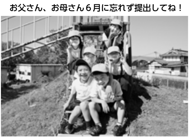
お父さん、お母さん6月に忘れず提出してね！