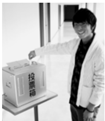
選挙に行きましょう！

夏に予定されている参議院議員通常選挙から適用される見込みです（平成27年6月19日公布、平成28年6月19日以降に公示される選挙から適用）。これにより、年齢要件を満たす高校生などが選挙権を得ます。選挙は政治に参加する貴重な機会です。皆さんぜひ投票しましょう。