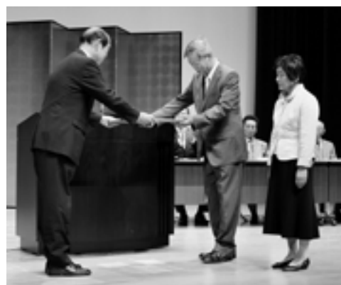
昨年の金婚夫婦式典で表彰を受ける夫婦