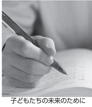
子どもたちの未来のために

▼日時 7月25日(月) 午前8時30分〜午後5時 ▼対象者 町内在住の小中学生1人と保護者1人で1組 ▼定員 20組(多数の場合抽選) ▼費用 大人1,800円 子ども1,600円(当日徴収)