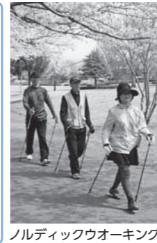
ノルディックウォーキング

▼日時 7月6日(水)・27日(水) 午前9時〜10時(ころ (雨天時は室内で開催)