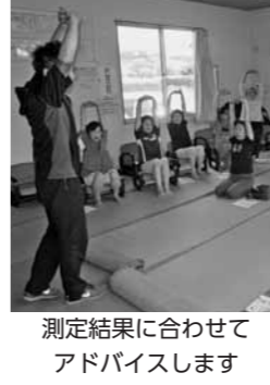
測定結果に合わせてアドバイスします

▼日時 8月23日(火) 午後2時～4時 ▼場所 福祉支援センター ▼内容 高精度筋量計フィジオンを使った筋量測定、体力測定、健康運動指導士のアドバイス ▼対象者 65歳以上の入居者 ▼定員 20人(先着順) ▼持参物 老眼鏡(必要な人) ▼申込方法 電話で申し込み ▼申込期限 8月19日(金) ▼申し込み・問い合わせ 介護予防係 ☎(232)2366